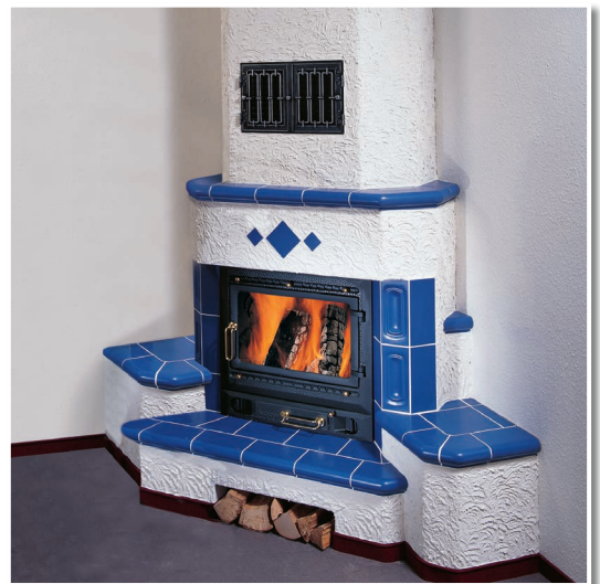
Kaminofen. Schamottesteine mit FEUERFESTMÖRTEL gemauert.